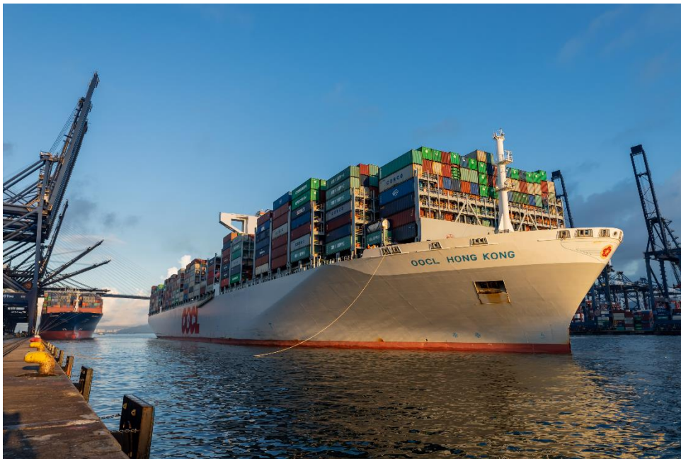
东方香港号靠泊香港海港联盟旗下的八号货柜码头