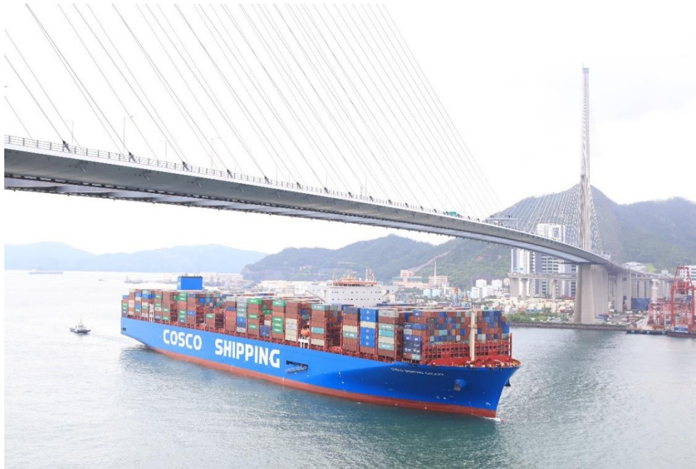
中远海运银河轮穿越昂船洲大桥进入香港葵青货柜码头