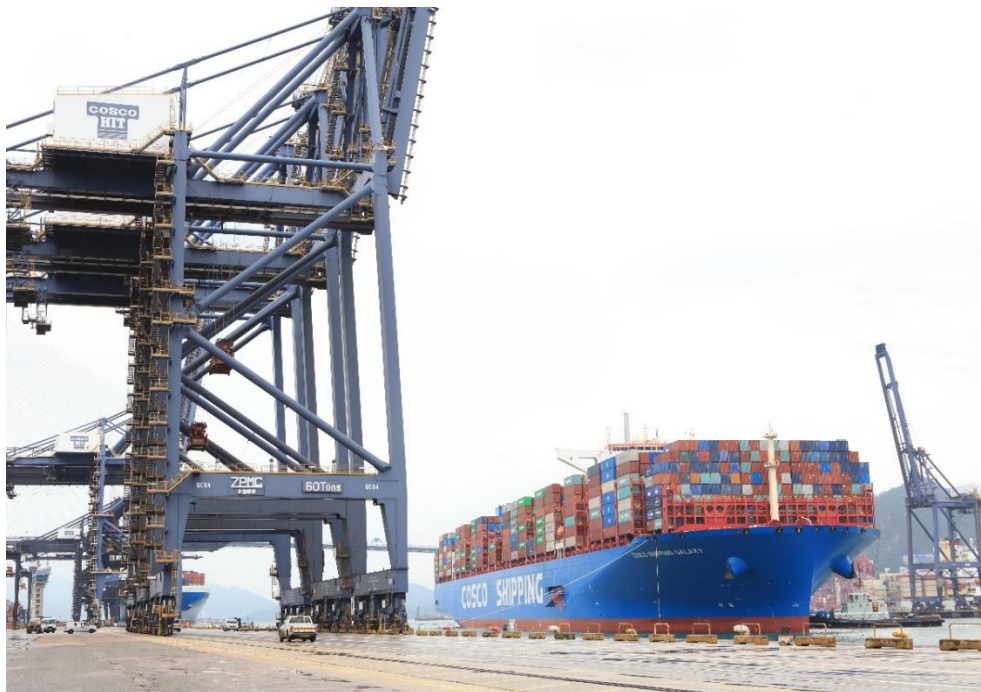
中远海运银河轮靠泊香港八号码头