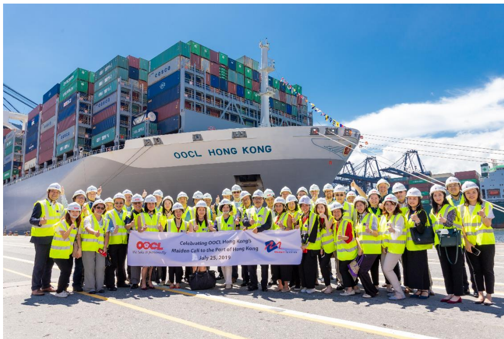
各嘉宾欢迎东方香港号首次靠泊香港